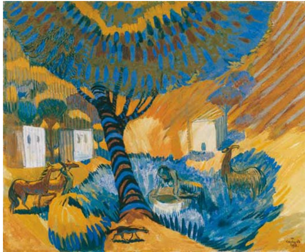
Bij de put. Een warme dag 1

het water valt de zon verbergt zijn tranen regen boogt grijs verdriet in kleur