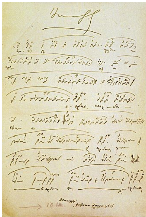
Origineel Manuscript van Komitas Vardapet. 4