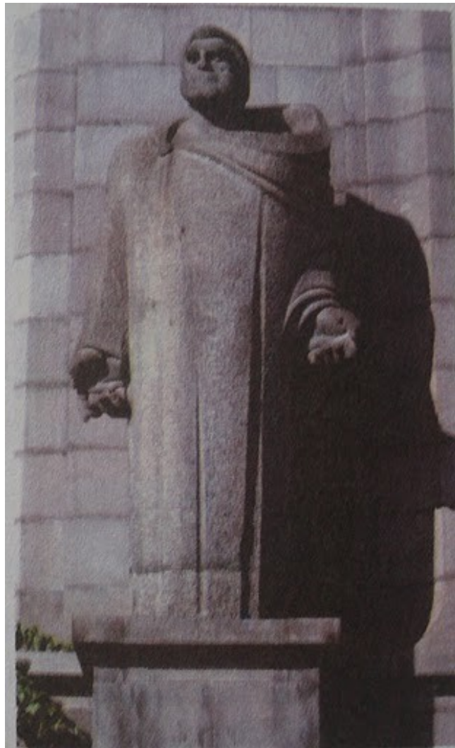
Frik [1234 – 1315]